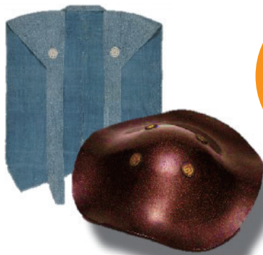
Damit ni Kaishu (Kataginu at Jin-gasa)

Sa Setyembre 7, 2022, ipagdiriwang ng Katsu Kaishu Memorial Museum ang ika-3 anibersaryo ng pagbubukas nito. May kabuuang 20 aytem (higit sa kalahati nito ay ipapakita sa unang pagkakataon) ang ipapakita sa first half at second half ng exhibition na ito, at ipaparating namin ang mga resulta at kahalagahan ng mga koleksyon at panunumbalik ng mga materyales na ito, na naging posible dahil sa donasyon ng maraming tao.