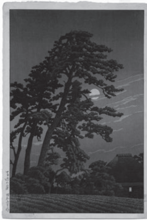
“Trăng Magome”, “Hai mươi cảnh Tokyo” - Tác phẩm năm Showa 5 (năm 1930)

Kawase Hasui là họa sĩ cư trú lâu năm và trải qua cuộc đời hội họa tại quận Ota. Kawase Hasui đi bộ khắp nước Nhật và vẽ phong cảnh bốn mùa của các địa phương. Cả cuộc đời ông đã vẽ hơn 600 tác phẩm. Cùng với các tác phẩm từ giai đoạn đầu đến những năm cuối đời, triển lãm đặc biệt lần này còn triển lãm sổ tay phác thảo, nhật ký, đồ dùng yêu thích, ảnh chụp v.v. chia theo giai đoạn đầu và giai đoạn sau. Giai đoạn đầu chủ yếu giới thiệu phong cảnh “Tokyo” là quê hương nơi Hasui sinh ra, có nhiều kỷ niệm, giai đoạn sau là phong cảnh “Những nơi du ngoạn” mà một người yêu thích rong ruổi đã từng đặt chân.