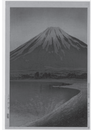
“Bình minh trên hồ Yamanaka”, vẽ tháng 8 năm Showa 6 (năm 1931)

Nhất định hãy đón xem cảnh đẹp Nhật Bản mà Kawase Hasui đã khắc họa.