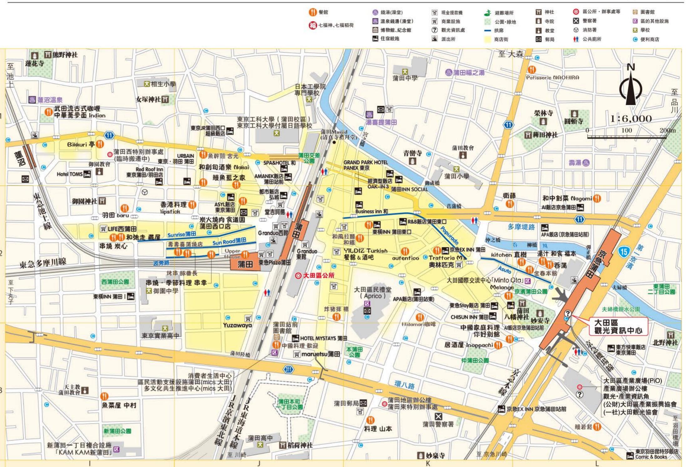
蒲田擴大圖 比例尺：1/6,000