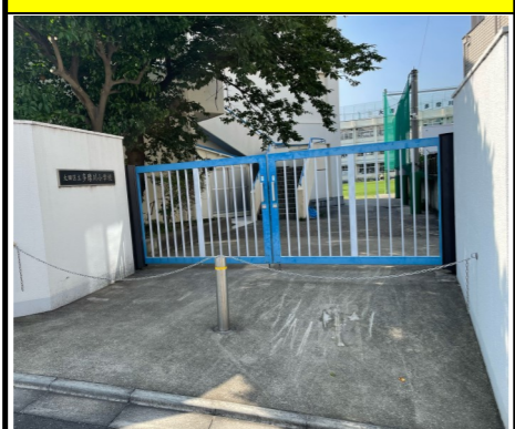
門名：南門 ※水害時は避難所開設されません。