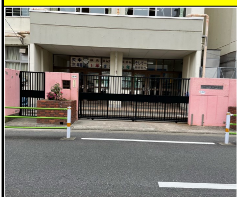
門名：西門 ※水害時のみ開放されます。