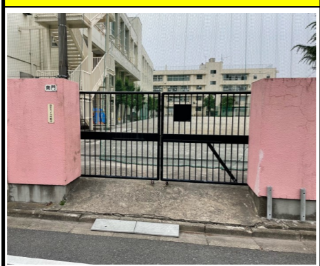
門名：南門 ※水害時のみ開放されます。