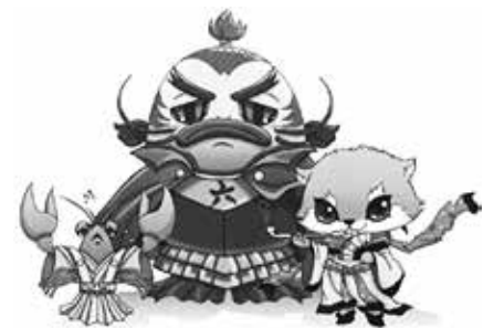
六郷こいぬし ざりのすけ かろうそまる