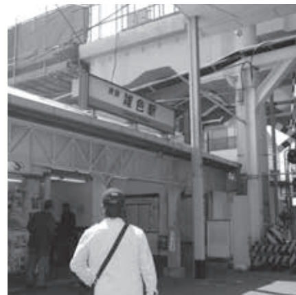
旧雑色駅 高架工事中 (2009年 当時)

仲六郷二丁目、三丁目に完成 写真は大田区高架下第八防災倉庫 (所在地：仲六郷三丁目27番地) (発電機、レスキューセットなどが 備蓄されています)