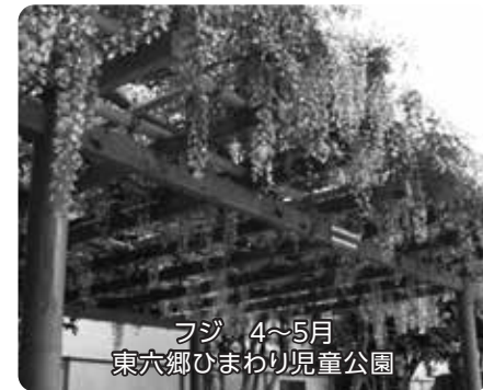
フジ 4~5月 東六郷ひまわり児童公園

春から初夏、多くの公園では、ウメ、サクラ、ハナミズキ、フジ、ツツジなどが咲いています。