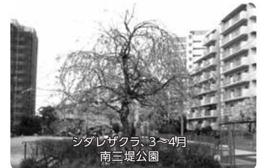
シダレザクラ、3~4月 南三堤公園