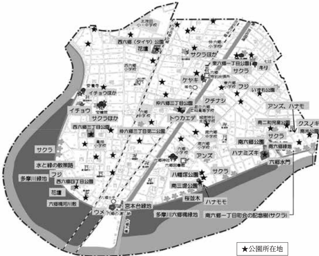
六郷地区 みどりと公園の図