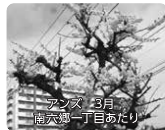
アンズ 3月 南六郷一丁目あたり

春、「六郷用水物語南掘のみち」にはピンクの花を咲かせるアンズやハナモモの木があります。