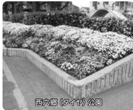
西六郷(タイヤ)公園

四季を通じて花壇が目を楽ませてください。他では見かけない秋の七草のクズ棚があります。9月頃紫の花が咲きます。