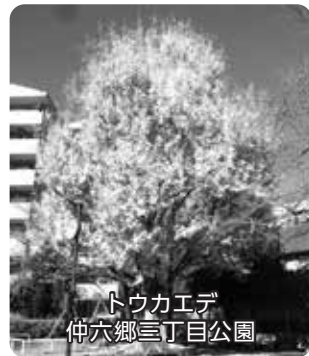
トウカエデ 仲六郷三丁目公園

四季を通じて花壇が目を楽ませてください。他では見かけない秋の七草のクズ棚があります。9月頃紫の花が咲きます。