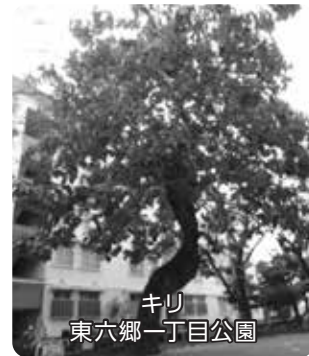
キリ 東六郷一丁目公園

「おおたの名木」 平成27年度に、まちの魅力向上に役立てるため巨木など後世に残したいみどりを「おおたの名木」として17本が選定され、六郷からは2本が指定されました。