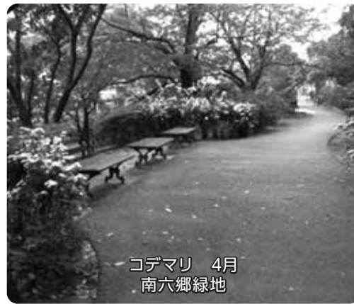
コデマリ 4月 南六郷緑地