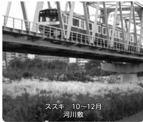
ススキ 10~12月 河川敷