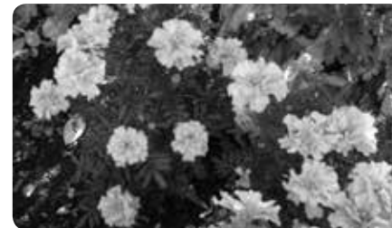
夏の花(マリーゴールド)