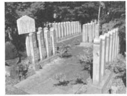
お砂踏み巡拝処(宝幢院)

正門を入った右手奥の一角に、かつて住職が四国お遍路の時に授かり持ち帰ったお砂が納められた「お砂踏み巡拝処」があります。 この場所に平成9年篤志家によって「四国八十八ヶ所霊