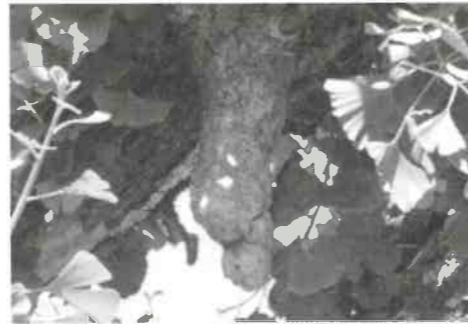
下垂の銀杏(安養寺)