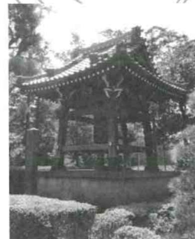
大田区最古の梵鐘(宝幢院)