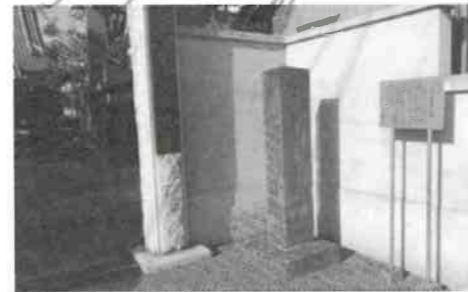
古川薬師道標(安養寺)