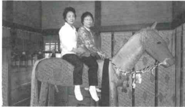
編集委員も乗馬体験（止め天神）