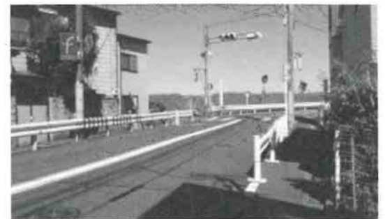
旧堤通りと筏道が交差する付近

りが利用することから旧堤通りの一部は「筏道（いかだみち）」とも呼ばれていました。 『大田の史話その2』 大田区史編纂委員会 当時の名残が感じられる場所を探してみませんか？