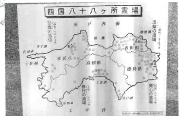
四国八十八ヶ所霊場案内板(宝幢院)

宝幢院(ほうどういん)をご存じでしょうか。大綱山宝幢院光明寺といい、真言宗智山派のお寺です。