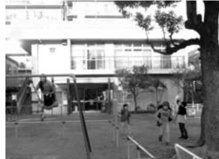
子どもたちとの会話も楽しみ

上の写真は昨年、クリスマス前に来館し楽しい時間を過ごしたあと、利用者の方が作ったリースをプレゼントしたときの様子です。