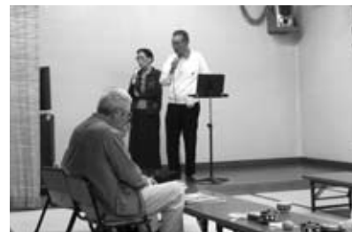
上手下手関係なく楽しめるのが良い!

玄関を入ると、正面に多目的に使用できる広々とした和室があり、カラオケや輪踊りに使われています。 一番人気のカラオケは、仲良くデュエットをする人や思い思いの曲を楽しみ姿が見受けられます。順番を待つ間、お弁当を食べたり、持ち寄ったお菓子等をみんなと分け合って、楽しい時間を過ごしているようです。 静養室では囲碁、将棋、読書などを行っています。そして、大田区には田園調布と仲六郷にしかない本格的なビリヤードを楽しむ部屋があります。その部屋は、いこいの家企画の講演や講習に使用されることもありますが、いこいの家に来て知り合いが増え、毎日通うのが楽しみになりました。