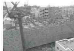
平成25年4月 4階までの躯体が完成

さて、工事は想像以上の難航を極めました。かつて基礎として使われた数十本もの松杭を地中から撤去し、京急線との境界では線路に「ミ」も歪みがでないよう慎重に掘削を進めました。特に、東日本大震災後の材料や人手の不足は深刻で、一時は工事の遅れを覚悟したことも。 こうした困難を乗り越え、新庁舎に関わるすべての人たちの英知と努力が実を結び、六郷住民への変革的なプレゼントが完成しました。 この『地域力の拠点』をどのように活かし輝かせていくか、私たちはこのことを胸に刻み、地域力推進センターを六郷の拠り所として、長く大切に利用していきたいと思っております。