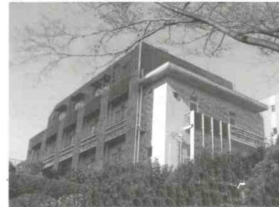
国道より新庁舎を望む 平成26年1月撮影