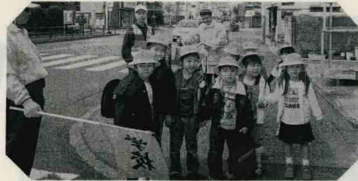
地域の安全を守るため見守り活動を行う（南六郷二丁目町会）