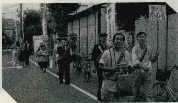
蒲田警察署の人たちと合同パトロール

そのほか、PTA・地域行事のお手伝い、月2回の学区内のパトロールを行っています。パトロールではすっかり顔なじみになり、地域の人と挨拶を交わすようになりました。