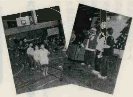
クリスマスの様子

全年齢を対象でツリーの飾り付けから始まり、ケーキ作り、ゲーム大会、手品、みんなで歌おう、などで楽しみます。