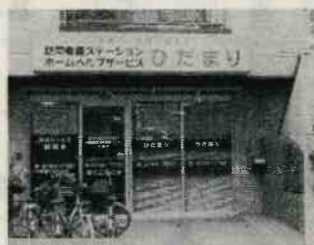
住所：仲六郷1-27-3 (雑色駅より徒歩5分)