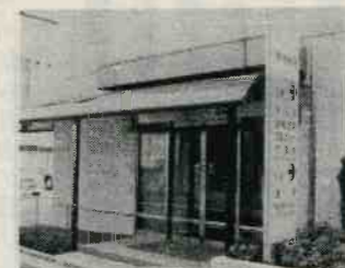
住所：南蒲田3-12-5 (糀谷駅より徒歩3分)

担当区域 南六郷1丁目～2丁目 東六郷1丁目～2丁目 南蒲田2丁目23番 28番～30番