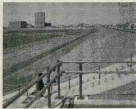
西六郷3丁目 区民広場付近