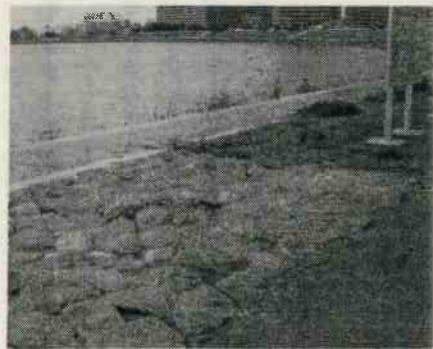
西六郷2丁目 古川薬師下付近

本誌36号で取り上げた多摩川 護岸工事が完成しました。 撤去された昭和初期の水制工 が有ったことを示す説明板が散 策路沿いに立てられ、石組みが 敷設され、往時を偲ぶことがで きます。