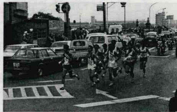
六郷橋付近のせりあい