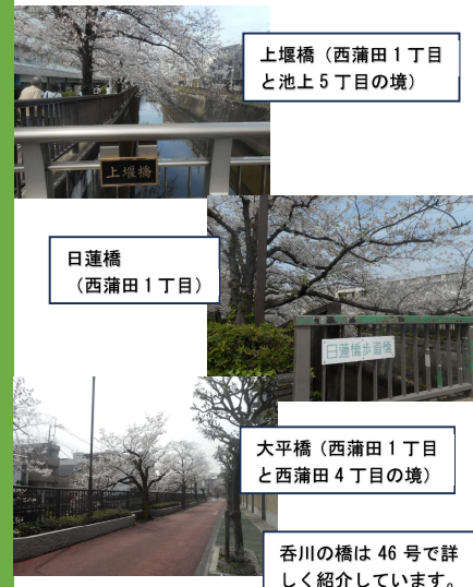
上堰橋(西蒲田1丁目と池上5丁目の境)

日蓮上人入滅日に万山の諸木の花が一時に開いたという伝説にちなんで三間(5.454m)ごとに桜を二千本植えたのが始まりです。