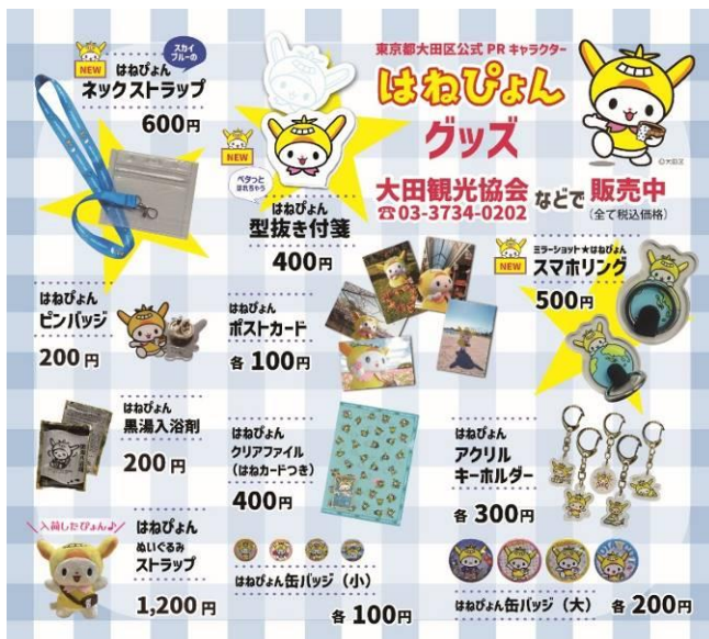
はねぴよんグッズ一式

昨年度からはねぴよグッズの製作及び販売を担う。区とともに上記イベント等へ参加し、グッズ販売、観光パンフレットの配架及びはねぴよん名刺の配布等を実施。