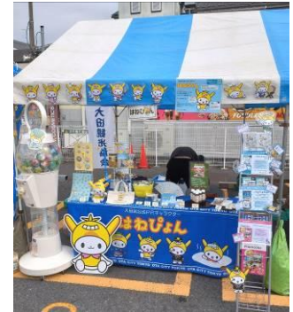
専用ブース・物販

全国のご当地キャラクター約30体が専用ブース、特設ステージ及び行進等を通じ、自治体のPRを実施。