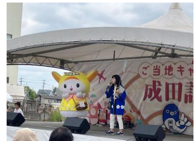
ステージで大田区をPR

埼玉県深谷市の「ふっかちゃん」と写ったはねぴよんのツイートは「762 いいね」を記録。