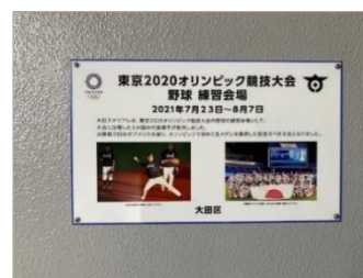
記念銘板(写真入り)