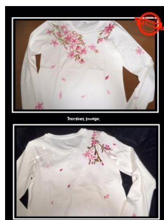
桜日和 手描き Tシャツ