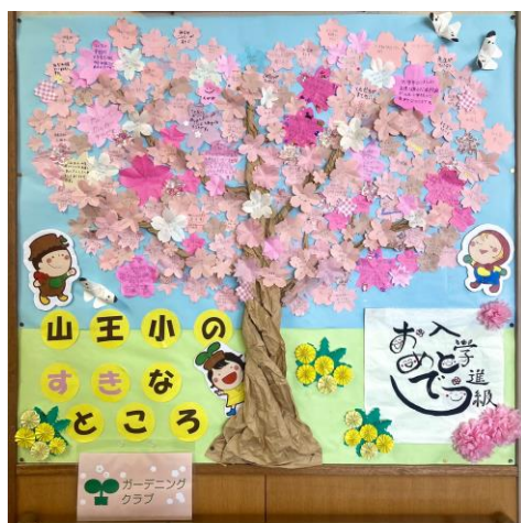
山王小のすきなところ