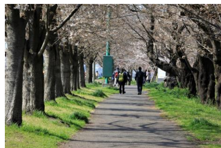
桜の散歩道（二十一世紀桜）