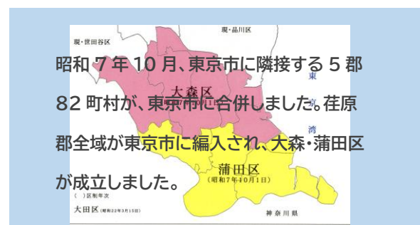
講座動画に挿入する画像の例