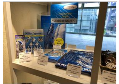
ブルーインパルス関連グッズが好評