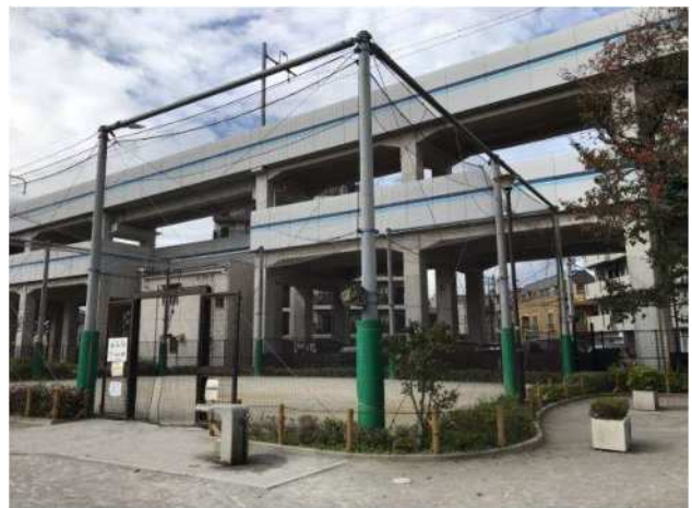
＜キャッチボール場イメージ＞