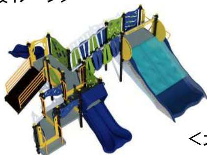
＜大型複合遊具イメージ＞