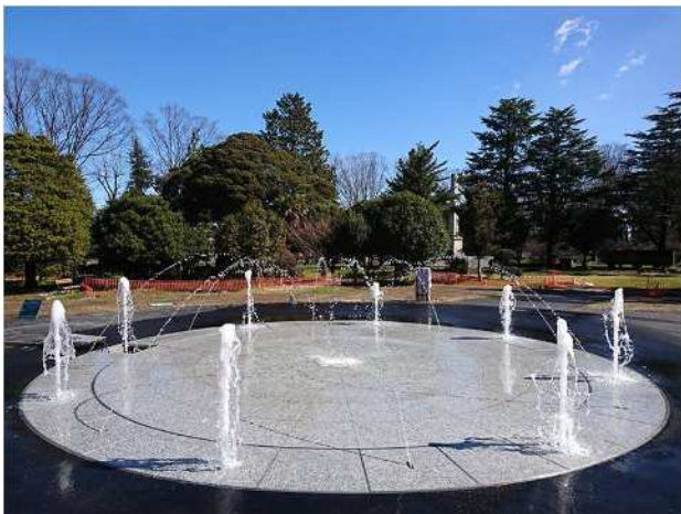
＜噴水施設イメージ＞