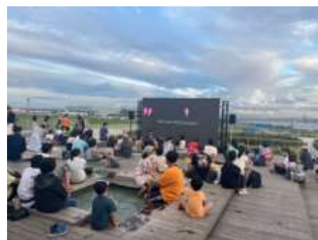
野外シネマ（足湯スカイデッキ）