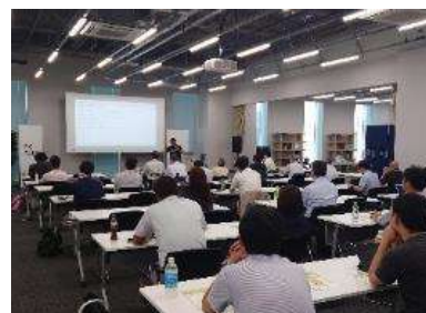
ベンチャーフレンドリー塾