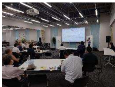
グローバルビジネス勉強会