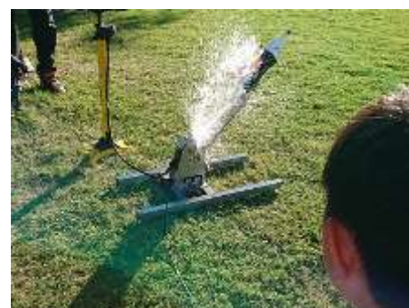
ワークショップ（ペットボトルロケット教室）