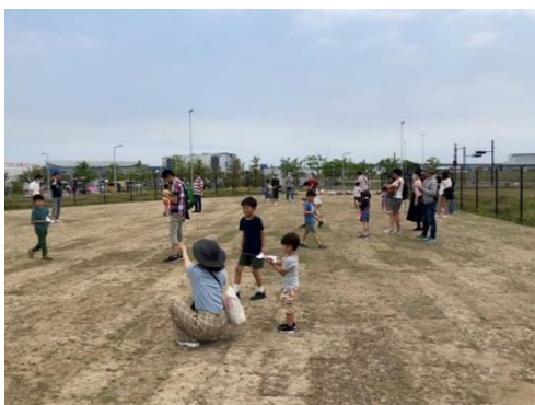
ワークショップ（羽田空港公園予定地）