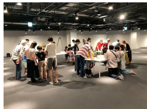
ワークショップ（羽田出島）