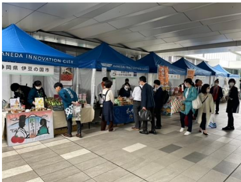
日本一周マルシェ（コリドー）