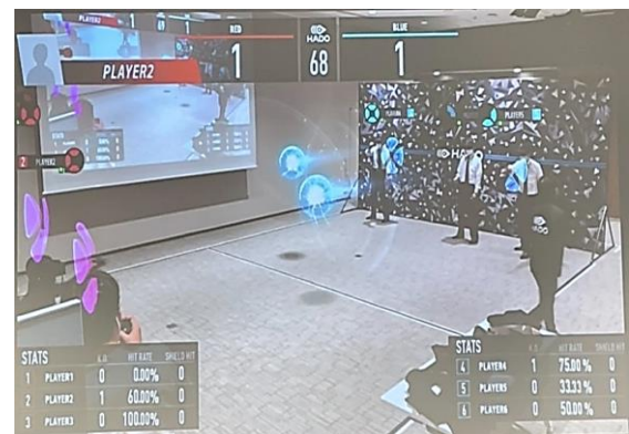
(2) AR スポーツ HADO