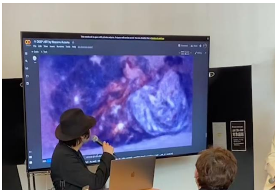
(1) AI が描く DEEP ART 展