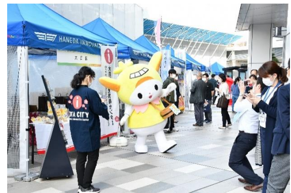
(4) 日本一周マルシェ