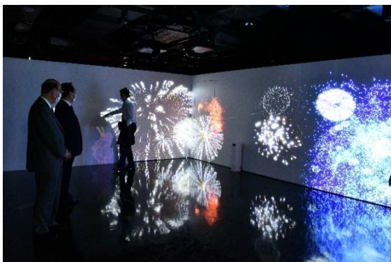
(3) 『縁日 ENNICHII』体験