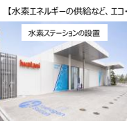
公共交通機関へのクリーンエネルギーの供給など環境負荷軽減に貢献