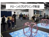
HICityならではの学びを通じた子ども達の生きる力を育む支援