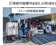
様々な分野での研究開発を促進し、技術の向上に貢献