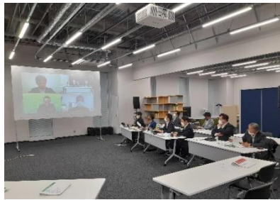
(11/12 開催のフード・アグリテックセミナー)