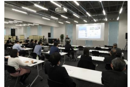
(11/17 OTA デジタル×PiO キックオフイベント)