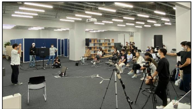
(8月に行われた配信イベントの様子)