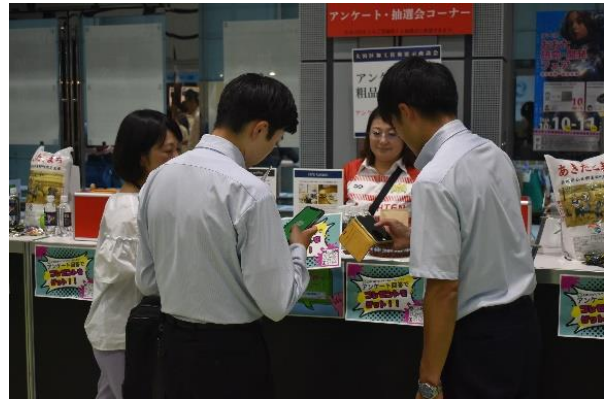
アンケートコーナー