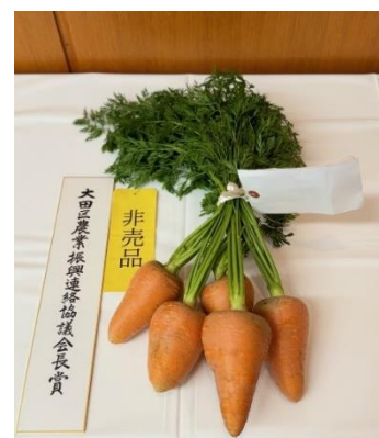
馬込大太三寸人参