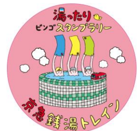
【昨年のヘッドマークデザイン】 直径 40 cm 1・4号車に設置