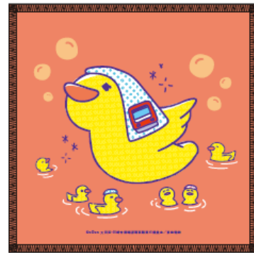
ハンドタオルデザイン