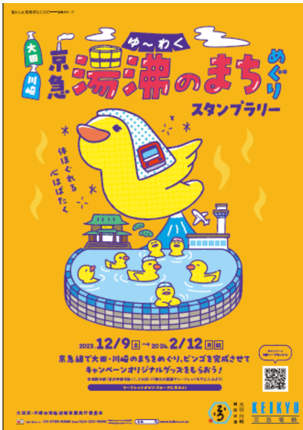
イベントポスター