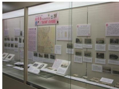
郷土博物館での展示風景