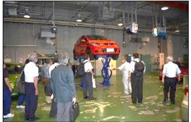
校内見学ツアー（整備実習室）