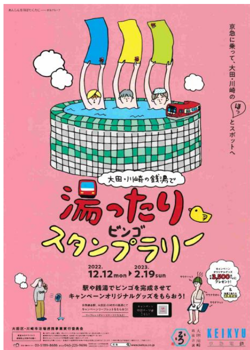
イベントチラシ（イメージ）