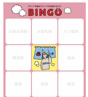
ビンゴカード（イメージ）