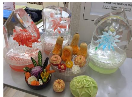
伝統工芸品（カービング）の展示

会場での実演に代えて、来場者に自宅で伝統工芸にふれていただけるよう、ワークショップキットを配布予定。