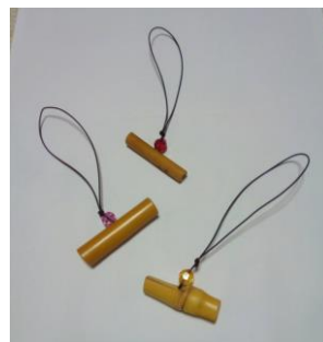
ワークショップ一例 （竹ストラップ）