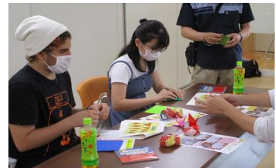
折り鶴の作り方を学ぶ大使