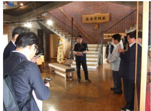
(江差追分会館での説明)

これまで本区とは、モニターツアーや物産展などへの参加等で連携を図っている。当初は、国からの交付金で賄っていた運営費（平成 30 年度：24,900 千円）も、現在は半分を一般財源で負担しており、限られた財源を、いかに大きな効果に繋げられるかは重要である。決して他人事ではなく、双方の連携の効果を少しずつでも高めていく施策を探ることが、本区のみならず、日本全体にとって、必要であることを痛感する視察となった。