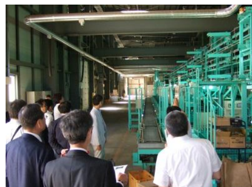
(厚沢部町農産物集荷施設内)