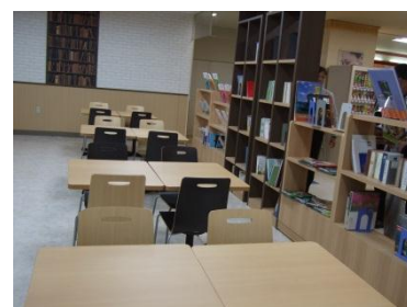
(イトーヨーカ堂旭川店内に設置されている学習スペース「 まな ビジョン pigeon」)