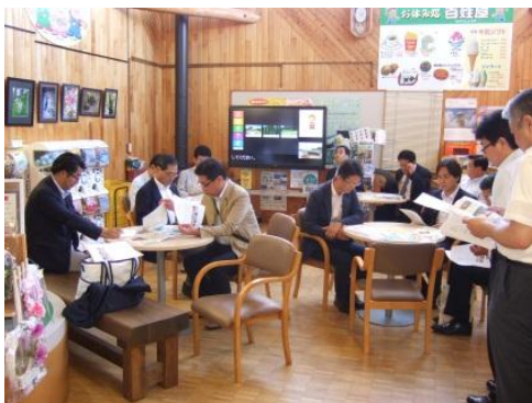
(道の駅「あっさぶ」内での説明)

主産業が農林水産業で、担い手も高齢化する中、人材育成がまさに死活問題であり、区としても人材交流などで支援するなどの協力が必要かと思いました。