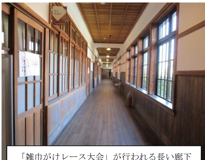
「雑巾がけレース大会」が行われる長い廊下

明倫学舎周辺は松蔭神社など、吉田松陰やその門下生など、幕末の偉人たちに所縁の地が点在しているが、鹿児島市の「維新ふるさと館」や大河ドラマ関連施設、寺社や史跡などが市内に密集しているロケーションとは対照的でもある。また、小学校の校舎として使われていた経緯から、歴史だけに限らず、長い廊下を利用した雑巾がけレース大会やお化け屋敷など、ユニークな子ども向け行事なども開催されている。