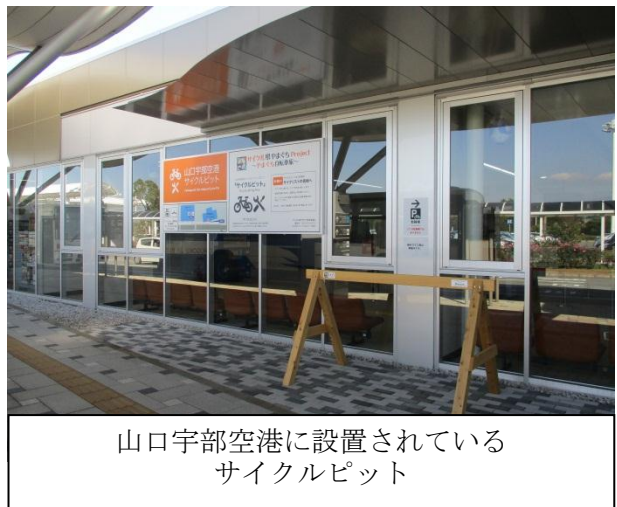
山口宇部空港に設置されている サイクルピット

知事がキーマンになることには間違いがない。何事も、いずれの地でも首長の裁量一つで物事が決まる。本区の良さをどのように発信していくか改めて考えてみたい。