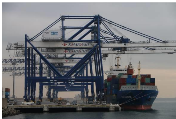
(令和島にあるコンテナ埠頭)

大田区に編入された中央防波堤埋立地の町名が、令和2年5月27日に開かれた令和2年第1回臨時会の全会一致による議決を経て、「令和島」に正式に決定した。町名の選定にあたっては、令和元年12月17日から令和2年1月31日まで一般公募を行った。一般公募では532件の応募があり、公募期間後には、有識者や地域の代表者を含めた大田区中央防波堤埋立地町名案選考委員会において、熱心な議論が行われた。この区域は、江戸時代から「生産と生活の場」として、海苔の養殖などを通じて、区の産業と地域社会を築いてきた歴史的沿革を持ち、現在の港湾計画では埠頭用地、港湾関連用地とされている。