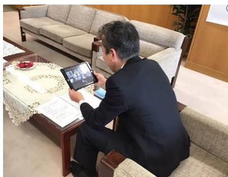
オンライン会議の様子①