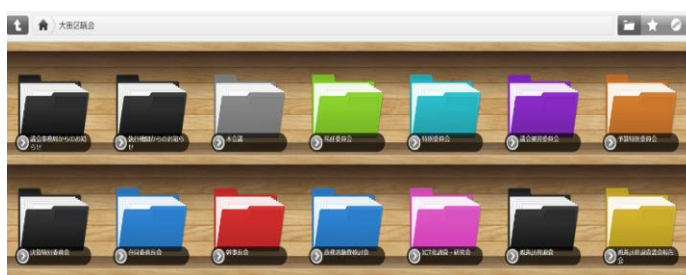
会議資料等をデータ化し、クラウド本棚へ配信