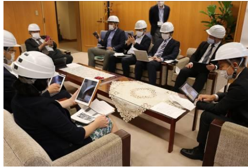
議会災害対策本部の設置運営訓練の様子