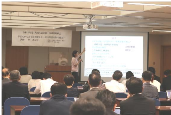
議員研修会の様子