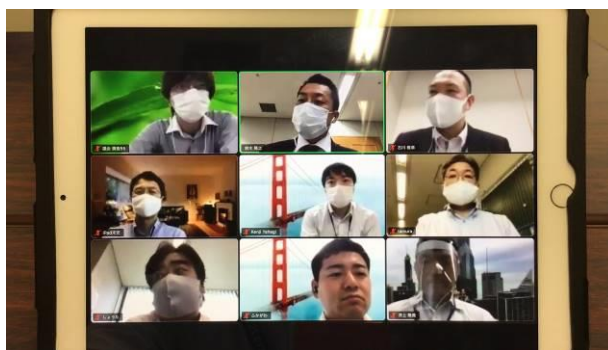
オンライン会議の様子②