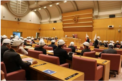
議場での訓練の様子