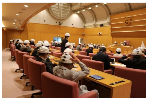
議場での訓練の様子