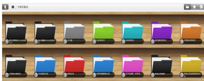
会議資料等をデータ化し、クラウド本棚へ配信