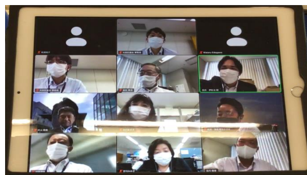
オンライン会議の様子②