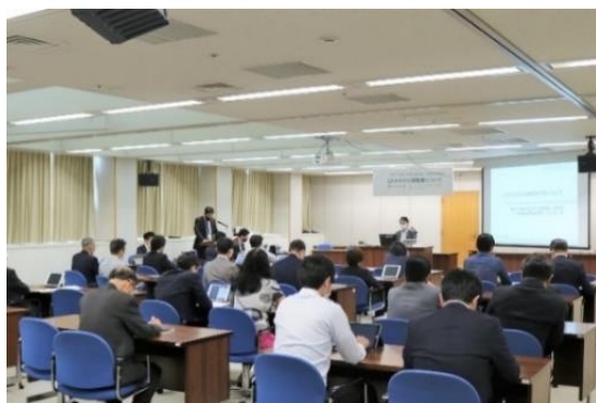
第2回議員研修会の様子