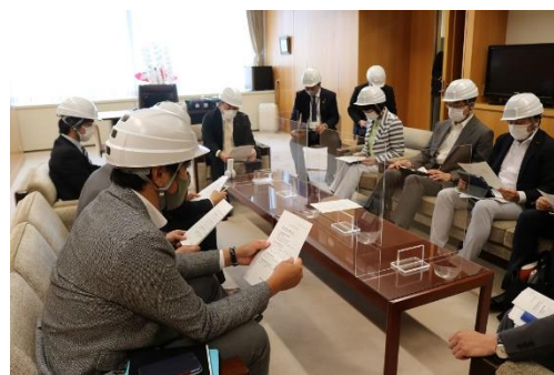
議会災害対策本部の設置運営訓練の様子