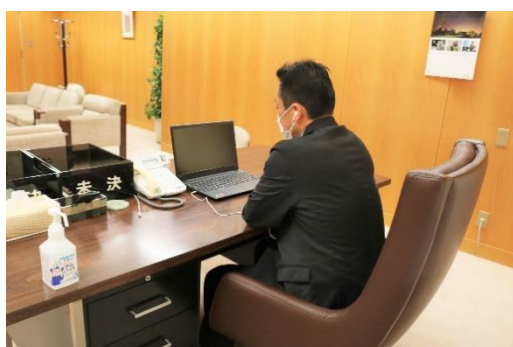
オンライン会議の様子①