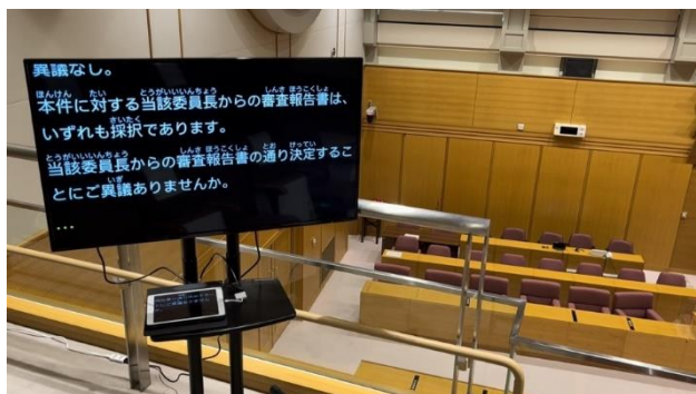
発言内容をモニターに文字表示している様子