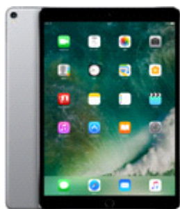
全議員に貸与開始