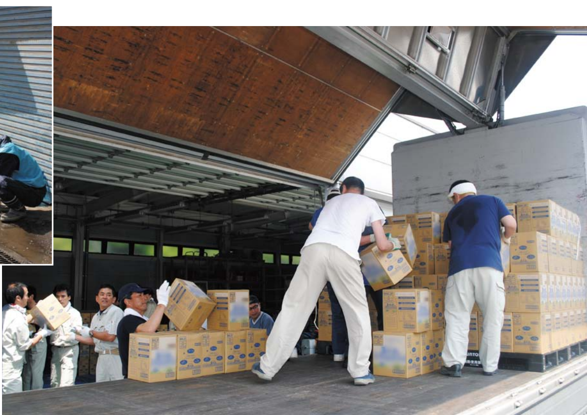
▶【非常食糧の備蓄】 今回の一般会計補正予算では、東日本大震災対応事業として、非常食糧の購入経費を計上した。写真は、大田区防災機材センターへの飲料水の搬入。