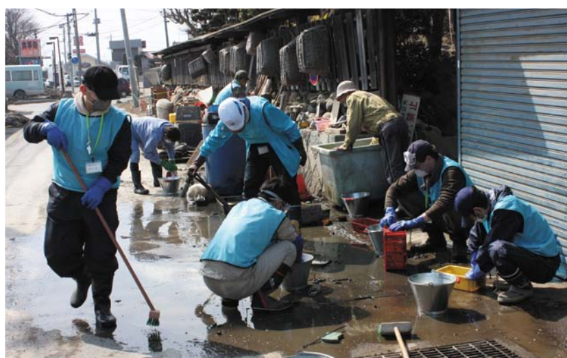
▲【緊急現地ボランティア活動(宮城県東松島市)】 区は、被災地支援ボランティア調整センターを立ち上げ、東松島市災害ボランティアセンターからの要請に基づき、津波被害の家屋の汚泥清掃などのボランティア支援を実施している。今回の一般会計補正予算では、被災地支援ボランティア調整センターの被災地支援に伴う経費などを計上した。

大田区議会は、平成23年第1回臨時会を5月23日から5月30日までの8日間の会期で開きました。今回の臨時会は、4月24日に行われた区議会議員選挙後、初めて開かれた議会で、議長、副議長選挙をはじめ、常任委員会、議会運営委員会、特別委員会の委員選任などを行い、新しい議会の構成を決めました。なお、今後の区政の課題に対応するため、観光・地域活性化対策特別委員会を新設したほか、交通問題調査、羽田空港対策、防災・安全対策の各特別委員会を設置しました(2~3面に議会の構成を掲載)。 この臨時会には、平成23年度一般会計補正予算(第1次)をはじめ、条例案3件、議会の承認を要する報告2件、議会の承認を要しない報告8件、監査委員及び副区長の選任に伴う同意5件の各議案が提出され、審議の結果、すべて原案どおり可決しました(4面に臨時会で決まった議案を掲載)。 また、選挙管理委員及び同補充員の選挙を行い、各4名を選出しました(4面に選挙の結果を掲載)。