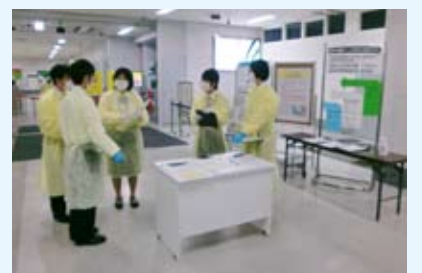
東京空港検疫所支所のような

新型インフルエンザが世界的に流行している現状を受け、羽田空港の検疫体制を確認するため、平成21年5月12日に羽田空港対策特別委員会が、羽田空港の東京空港検疫所支所を視察しました。羽田空港では、ソウル・上海・香港からの直行便が毎日定期運行しており、約3千人が入国しています。この中には、まん延国からソウル等を経由した渡航者がいる可能性があるにもかかわらず、まん延国の滞在有無は旅行者が自主的に申告する方法によって検疫が実施されており、検疫体制の充実が望まれます。なお、大田区議会は、国会・関係所管大臣に対して、左記のような意見書の提出を議決しました。