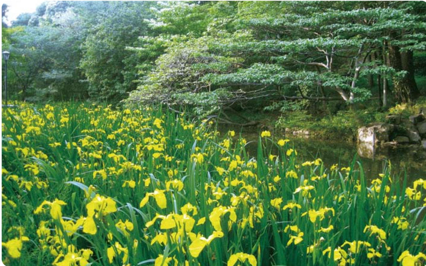
宝来公園の黄菖蒲【場所】宝来公園【交通】東急東横線・東急目黒線 田園調布駅から徒歩約5分

発行 大田区議会 〒144-8621 大田区蒲田五丁目13番14号 電話 03-5744-1474(直通) ホームページ http://www.city.ota.tokyo.jp/gikai/