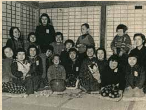
疎開した矢口東国民学校の児童が談笑する様子