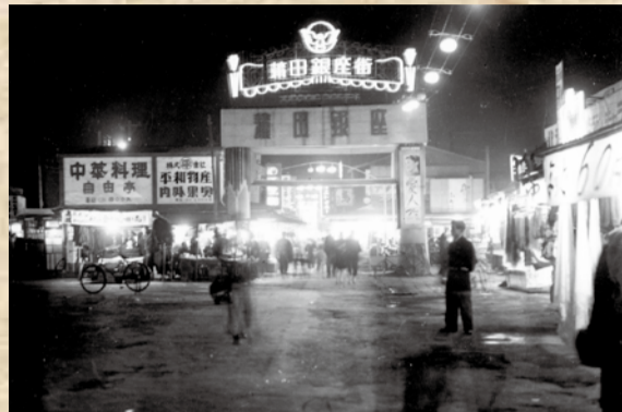
「自由亭」や「平和物産」の名称に戦後の時代を感じる蒲田駅西口の夜景(昭和28年撮影)