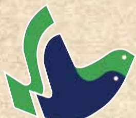
昭和63年 大田区平和都市宣言記念シンボルマークを決定