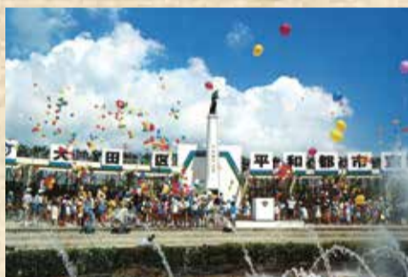
大田区平和都市宣言式典(昭和59年8月15日撮影)