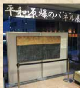
平成2年より実施している「平和・原爆のパネル展」