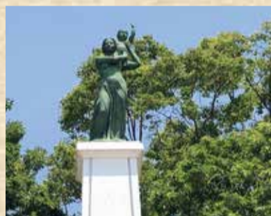
平和の森公園「愛し子」像