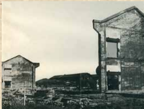
昭和20年5月の空襲を受けた矢口東国民学校