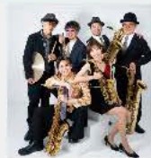
「HIBI★Chazz-K」(ヒビ チャズケ) 子供から大人まで誰もが笑顔でしまう ストリート・ジャズ・サックス・アンサンブルバンド