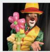
「PeppiTheClown」(ペッピー・ザ・クラウン) みんなで笑顔！ニューヨーク生まれの ユーモアたっぷりのクラウンパフォーマンス