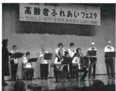
高齢者ふれあいフェスタ