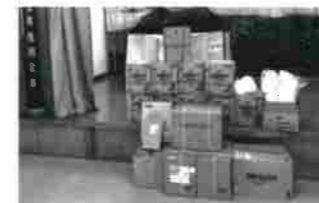
水、毛布、ソーラーパネルなど