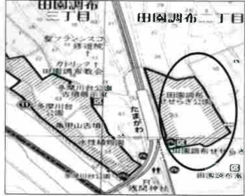
《多田園調布せせらぎ公園》 東急多摩川線多摩川駅より 徒歩1分

青少年対策鶺鴒の木地区委員会 春の恒例行事「子どもガーデンパーティー」が本年から4月の最終日曜日に開催される運びとなりました。