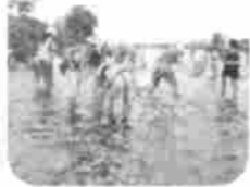
☆子供の感想☆ いろいろな生きものが見られて、楽しかった。木の上にへびがいて、びっくりした。