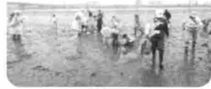
一面のカニにびっくり!