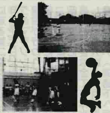
白熱したゲームの連続でした!!

野球、バスケットともに手に汗握る試合ばかりで、夏の暑さに負けないう「熱い」試合の連続でした。