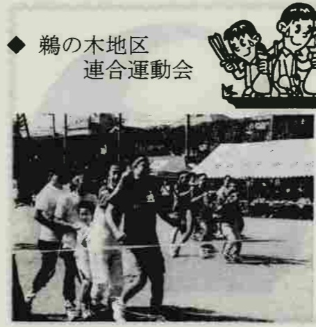
◆ 鶴の木地区 連合運動会