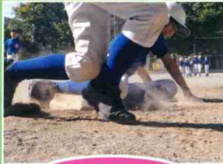
赤松フライヤーズ