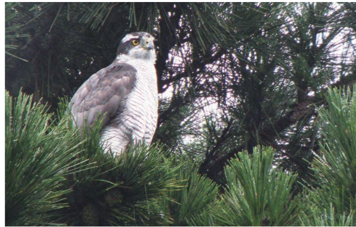
オオタカ 至近距離での確認は大変珍しい