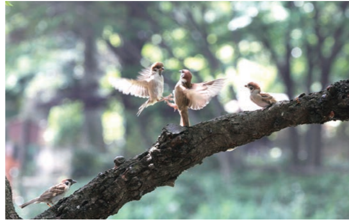
じゃれ合うスズメ