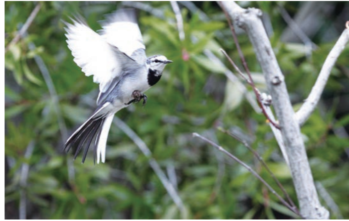
ハクセキレイ 道上で尾をフリフリ歩く姿が可愛い