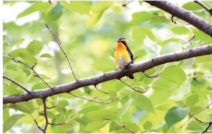
渡りの途中で飛来したキビタキ