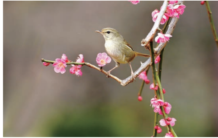
「区の花」ウメの共演 「区の鳥」ウグイス