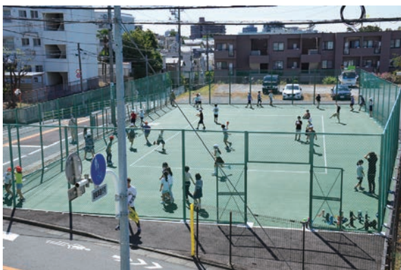
▲正門前の仮設運動場

現在の赤松小学校は、西側校舎が解体され、新校舎の建設が行われています。なお、職員室のある旧北側校舎の一部や給食室のある東側校舎及び体育館は残されています。 改築にあたり、仮設校舎を校庭に設置することとなり、地域住民への校舎改築の説明会で、「一体を思いきり動かせない子供たちのために正門前の駐車場を運動場として借りることは出来ないか？」との意見がありました。今年8月に、駐車場の一部が仮設運動場として整備され、2学期から子供たちは元気に楽しく利用しています。