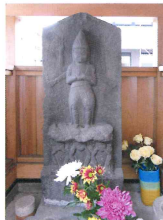
嶺の四庚申のうち①

南・田園調布本町は下沼部村と呼ばれ、世田谷領でした。嶺村の範囲については、当然時代によって多少の変化はありますが、昭和はじめ頃「調布嶺町一丁目」と呼ばれていた地域が目安になります(図参照)。また、江戸時代中期に建てられた「庚申(こうしん)供養塔」は、悪疫退散の御利益がある「青面金剛」が刻まれた石塔を村境に設置することで、村内への疫病の浸入を防いだと考えられます。嶺村の南西部地区では、四方に置かれ