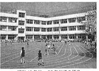
昭和40年代～50年代頃の様子

私ですが、私が卒業したかっ たって思うほど大好きな学校です。 自然がいっぱいの松仙小学校。たくさん元気が笑顔がいっぱいの松仙小学校。今までもこれからも、松仙小学校の皆様、たずさわった皆様、たくさんの笑顔が溢れますように。 松仙小学校の お誕生日に 乾杯!!