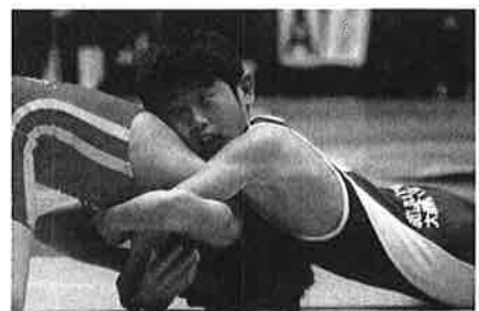
ました。(船木 伸子 五選 幸美)