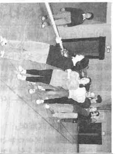
なかつた楽しみとなった。綱引きは綱を両手でつかみ

私は、回覧板の綱引きチーム「ドリムス」のチラシを見て軽い気持ちで練習に参加した。はじめ心配したのはチームの人達との人間関係だった。はじめなかったらどうしようなんて、心配したが、杞憂だった。技術も体力もない私にわかりやすく教えてくれた。年齢も仕事も違う人やお母さんが連れてくる子供と話せることが、今までの生活にな