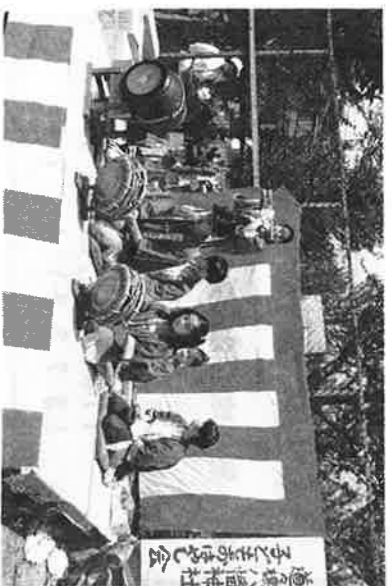
「道々橋の子どもばやし」