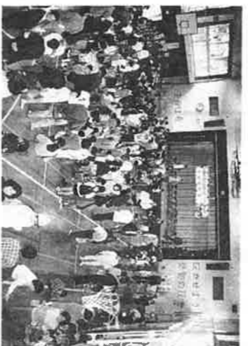
委員会からのお知らせ

狭い体育館の中で二千人を超える人々が楽しむ四月三十日に行われた大田区子どもガイデンパレードは、準備万端整ったにもかかわらず、当日は朝からの雨。大い